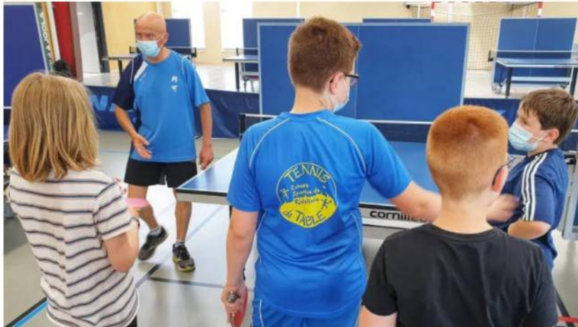
Les jeunes ont participé avec application aux exercices.

Dans le cadre de la relance de l'activité, le comité d'Indre-et-Loire de tennis de table a organisé, samedi, au gymnase Bellevue, un plateau avec 22 jeunes licenciés venus de plusieurs clubs du département.